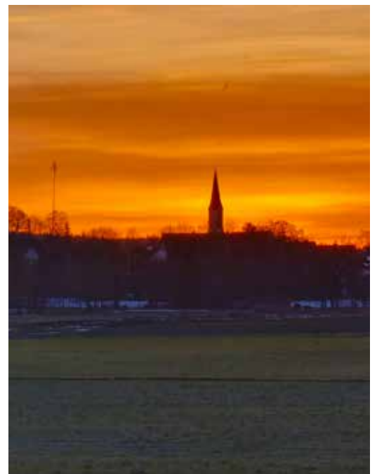
Dieses stimmungsvollen Bilder mit Blick auf die Pfarrkirche Mariä Heimsuchung in Stoffen hat unser Leser Karsten Nachbaur eingesandt.